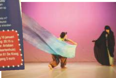
Voorstelling De Kleurendief

(inmiddels 78) te gast met de voorstelling 'Frits!'. "Via via kwamen we aan hem. Een unicum, super."