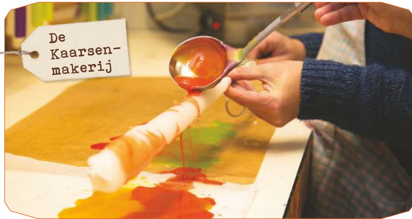
Een vrolijk gekleurde tuinfakkel in de maak