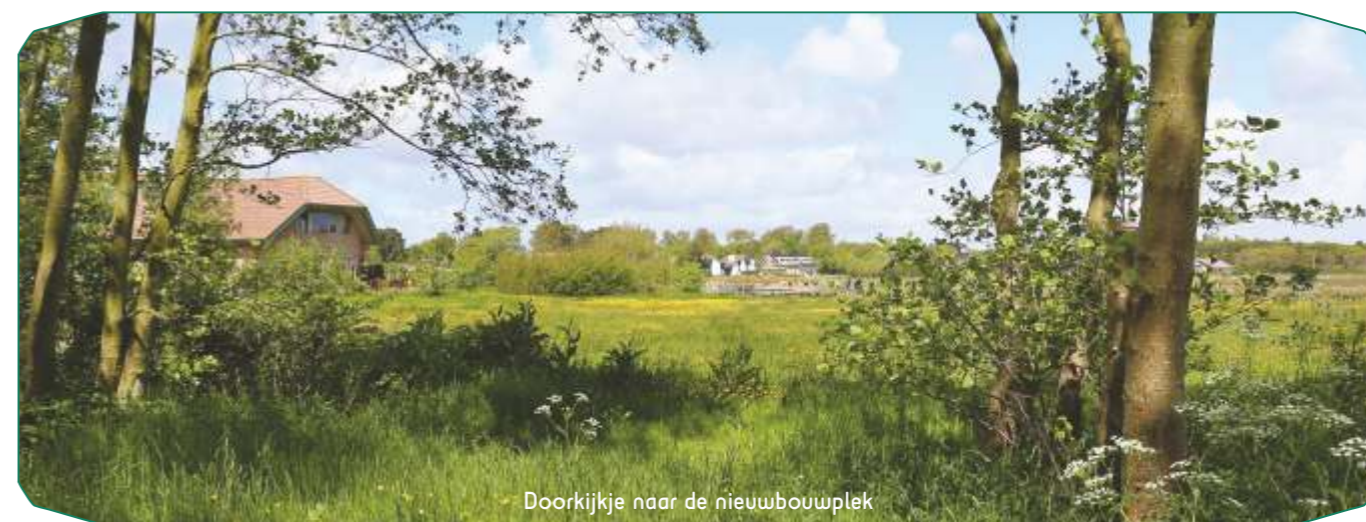
Doorkijkje naar de nieuwbouwoek

Voor de aanwezigen, afkomstig van Camphills uit het hele land, vloog de dag voorbij. Vol inspiratie en met een blij, opgeladen gevoel gingen de Maartenhuis-medewerkers terug naar Texel. De dag werd daar afgerond met een gezellig etentje. De positieve effecten vallen in het Maartenhuis nog steeds op. "In de omgang met collega's is er weer een flinke scheut olie in de machine te merken."